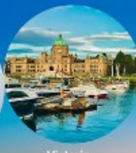
Victoria, British Columbia (Canada)