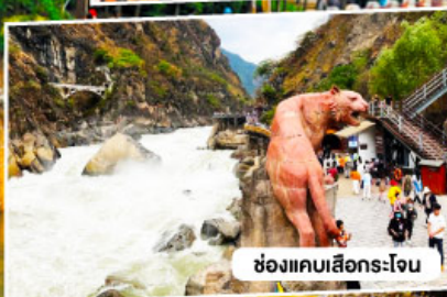
ช่องแคบเสื่อกระโจน