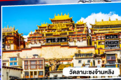
วัดลามะชงจ้านหลิง