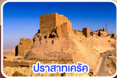
ปราสาทครีค