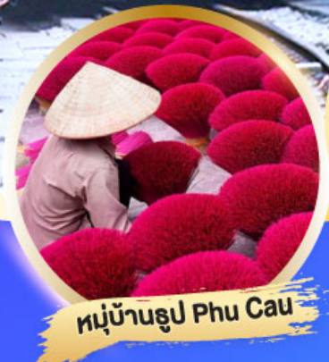
หมู่บ้านรูป Phu Cau