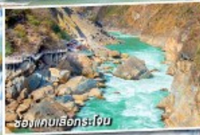
ช่องแคบเลือกระโจน