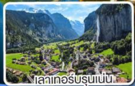
เลาเทอร์บรุนเนน