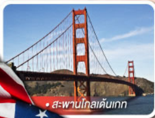
• สะพานโกลเดนเกต