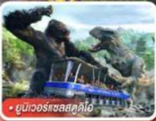
ยูนิเวอร์แซลสตูดิโอ