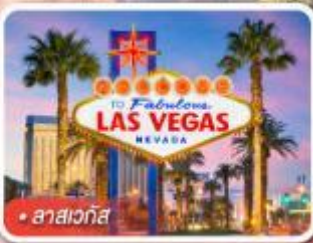
ลาสเวกัส