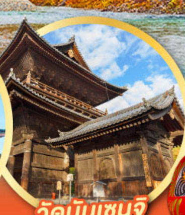
วัดนินเซนจิ