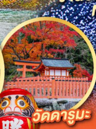
วัดดารุมะ