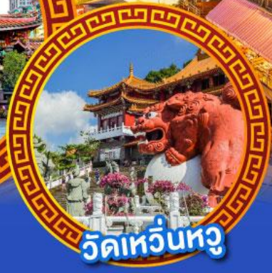
วัดเหวี่ยนหู่