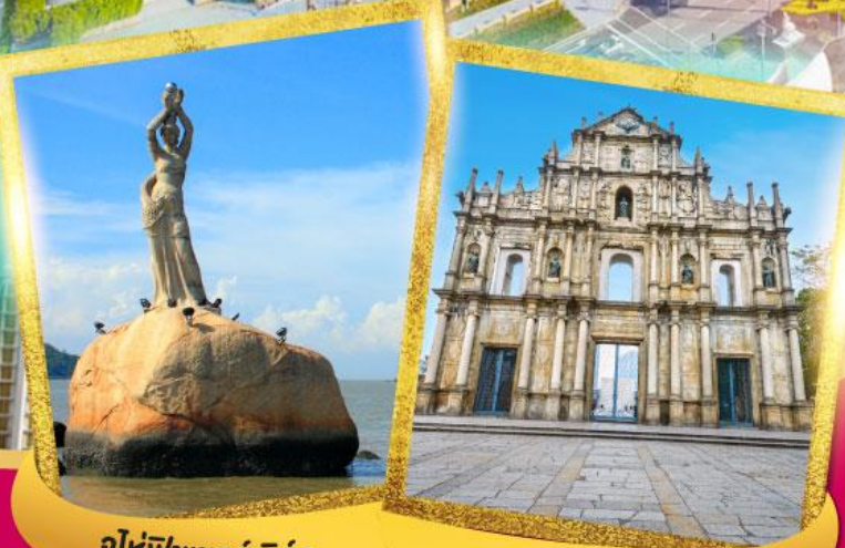
จูไห่พีชเชอร์เกิร์ล