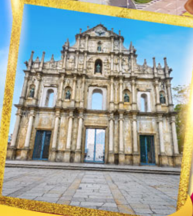
วิหารเซนต์ปอลเซนต์ปอล

เดินทาง 12-14, 16-18 พ.ค. 67 23-25 พ.ค. 67 30 พ.ค.-01 มิ.ย. 67 13-15, 16-18 มิ.ย. 67 20-22, 27-29 มิ.ย. 67 30 มิ.ย.-02 ก.ค. 67