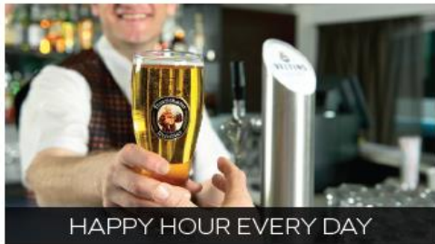
HAPPY HOUR EVERY DAY

Enjoy a drink with newfound friends - serving premium spirits, wines, beers and cocktails at reduced prices. Why not try a cocktail from the extensive Active & Discovery™-inspired bar menu?