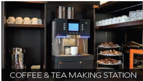
COFFEE & TEA MAKING STATION

Enjoy a drink with newfound friends - serving premium spirits, wines, beers and cocktails at reduced prices. Why not try a cocktail from the extensive Active & Discovery™-inspired bar menu?