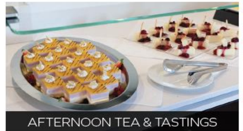
AFTERNOON TEA & TASTINGS

The Club Lounge offers specialty coffees around the clock, as well as a range of teas and cookies - all complimentary! (Also available in the Panorama Lounge).