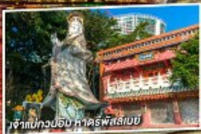
เจ้าแม่กวนอิม หาดรีฟสส์เบย์