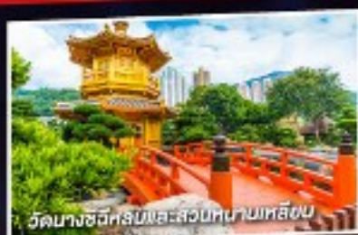
วัดนางชีหรือส่วนหน้าพลับพลา