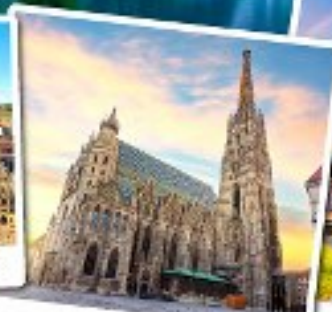
มหาวิหารเซนต์สตีเฟ่น