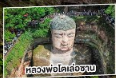
หลวงพ่อดเล่อซาน