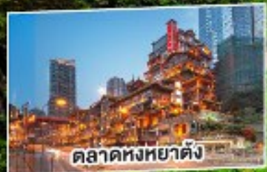
ตลาดหงหยาดัง