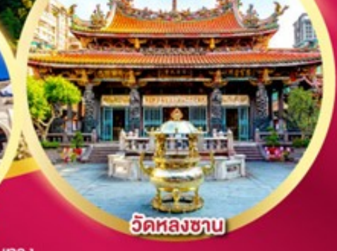
วัดหลงชาน