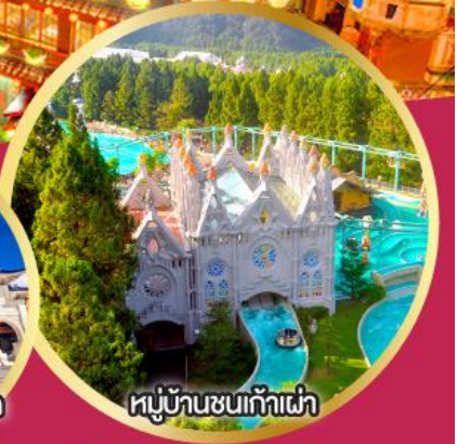
หมู่บ้านชนก้าเผ่า