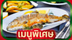
เมนูพิเศษ ปลาเทราต์ย่าง