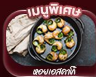
เมนูพิเศษ