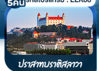
ปราสาทบราติสลาว่า