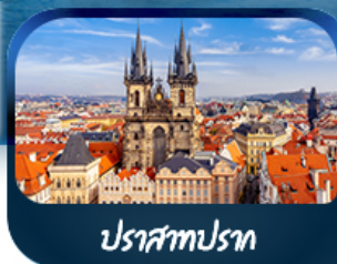
ปราสาทปราก