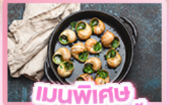
เมนูพิเศษ หอยเอสคาโท