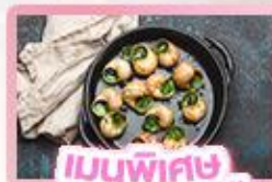
เมนูพิเศษ หอยออสตาโก้