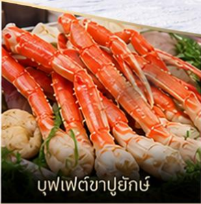
บุฟเฟต์ซาปูยักซ์