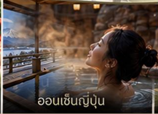
ออนเซ็นญี่ปุ่น