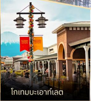
โทเทมเบเอาก์เล็ด