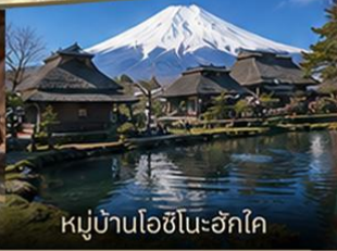
หมู่บ้านโอชิโนะอักษโค