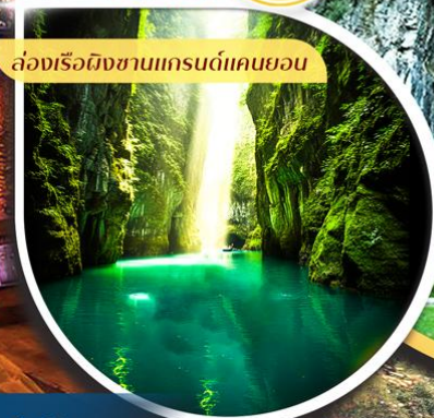
ล่องเรือผิงซานแกรนด์แคนยอน

คอนเสิร์ตออกเดินทาง ตั้งแต่ 10 ท่าน ขึ้นไป