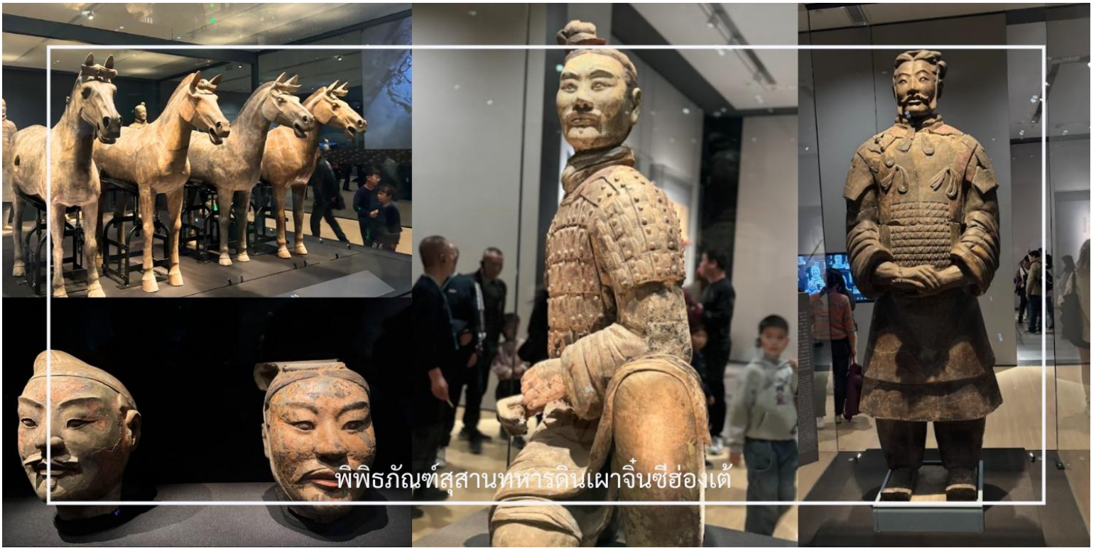
พิพิธภัณฑ์สุสานทหารดินเผาจีนซีอองใต้

สมควรแก่เวลา นำท่านเดินทางสู่ เมืองซีอาน (Xi'an) ใช้เวลาเดินทางประมาณ 1 ชั่วโมง เมืองหลวงเก่าแก่ของมณฑลส่านซี และเป็นหนึ่งในเมืองประวัติศาสตร์สำคัญของจีน ที่เคยเป็นเมืองหลวงของหลายราชวงศ์ เช่น ฉิน ฮั่น และถัง จึงเต็มไปด้วยเรื่องราวทางประวัติศาสตร์และโบราณสถานสำคัญมากมาย