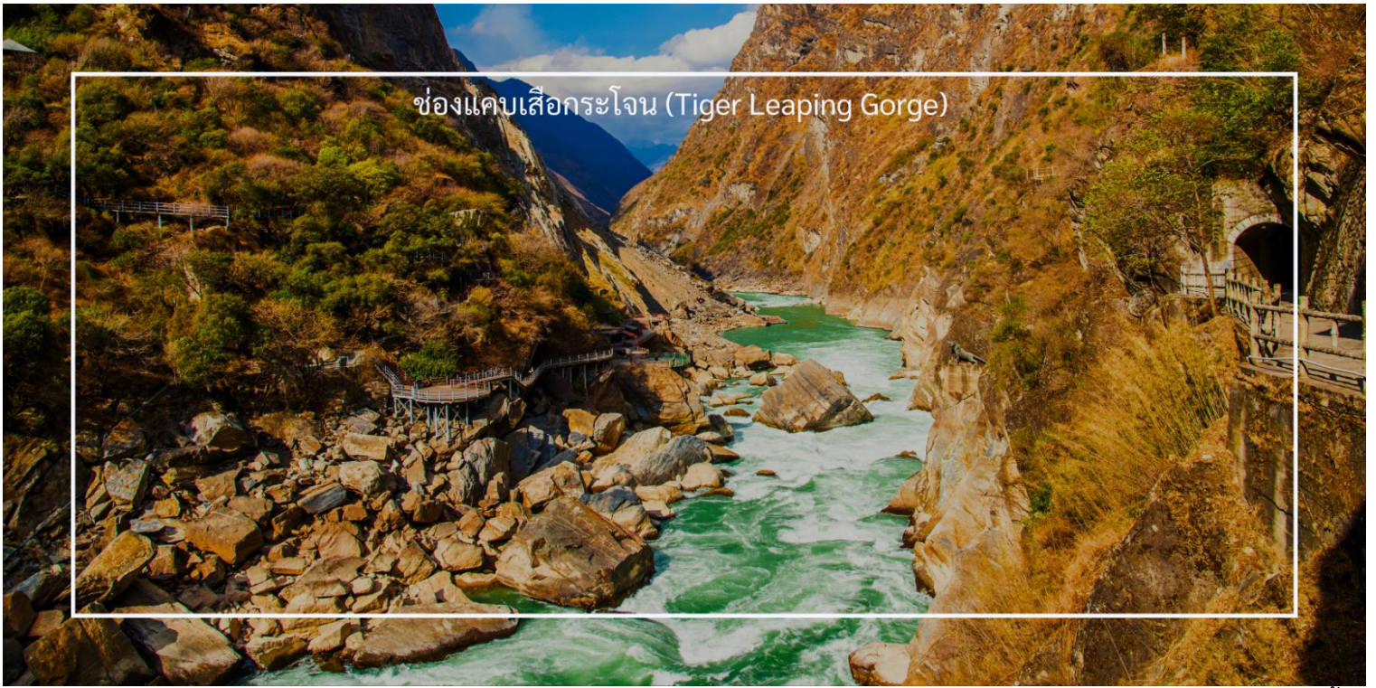
ช่องแคบเสือกระโจน (Tiger Leaping Gorge)

เที่ยวชม เมืองโบราณแชงกรีล่า (Shangri-La Ancient Town) เป็นสถานที่ท่องเที่ยวที่โดดเด่นในเมืองแชงกรีล่า ซึ่งตั้งอยู่ในมณฑลยูนนาน ประเทศจีน เมืองโบราณนี้มีความสำคัญทั้งในด้านประวัติศาสตร์และวัฒนธรรม เมืองโบราณมีบ้านเรือนที่สร้างขึ้นในสไตล์ทิเบตและชาวหนาน ซึ่งมีการตกแต่งที่สวยงามและมีเอกลักษณ์เฉพาะตัว เป็นศูนย์กลางวัฒนธรรมของชาวทิเบต มีตลาดที่ขายสินค้าท้องถิ่น เช่น เครื่องประดับแบบทิเบต ผ้าทอมือ และอาหารพื้นเมือง นักท่องเที่ยวสามารถเลือกซื้อของที่ระลึกและสัมผัสกับบรรยากาศของตลาดที่มีชีวิตชีวา เมืองโบราณตั้งอยู่ใกล้กับสถานที่ท่องเที่ยวสำคัญ เช่น วัดชงจ้านหลิง (Songzanlin Monastery) ซึ่งเป็นวัดที่สำคัญที่สุดในเขตนี้