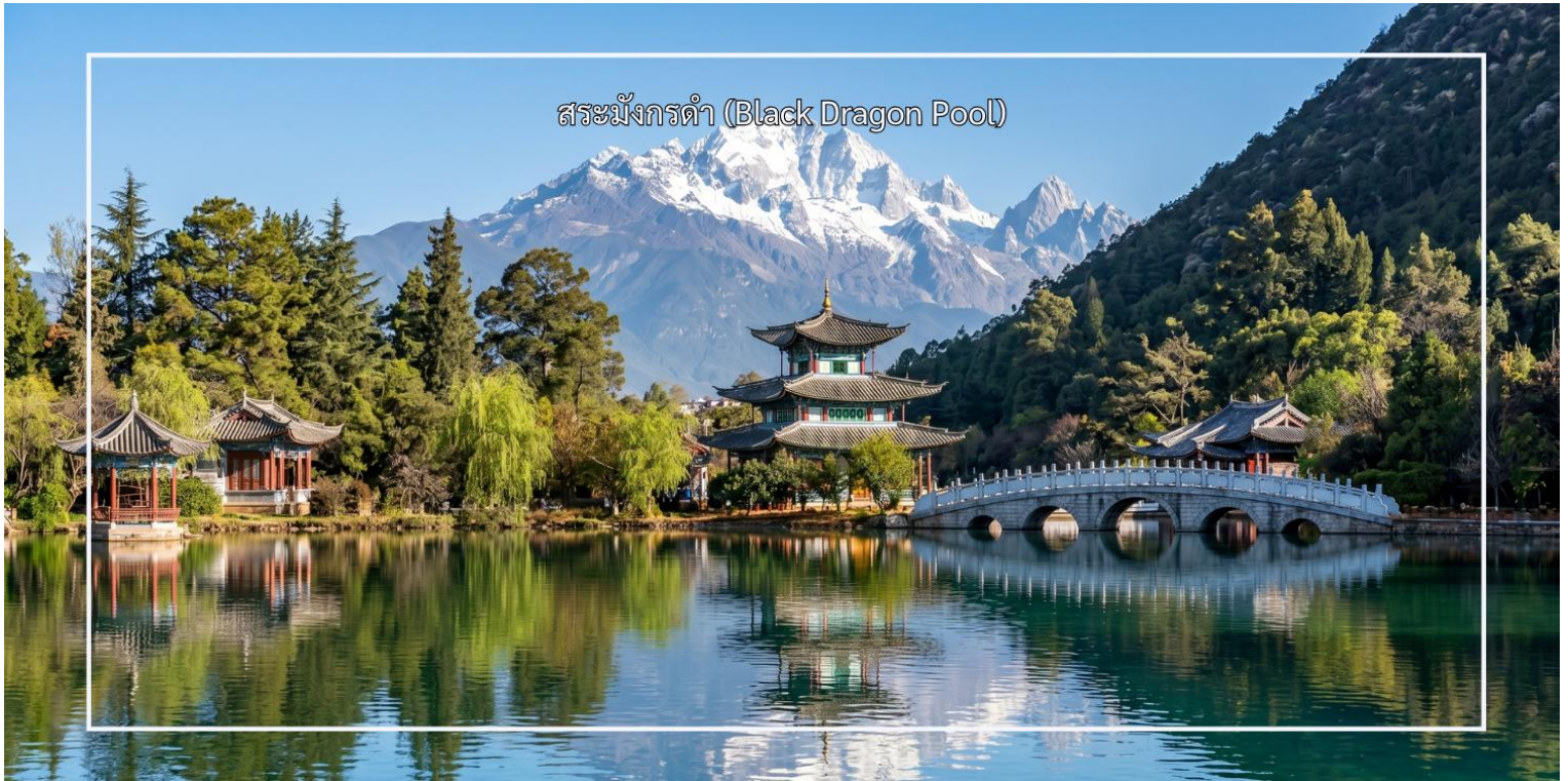
สระมังกรดำ (Black Dragon Pool)

เที่ยวชม เมืองโบราณลี่เจียง (Lijiang Ancient Town) เป็นหนึ่งในเมืองโบราณที่มีชื่อเสียงและได้รับการขึ้นทะเบียนเป็นมรดกโลกจากองค์การยูเนสโกในปี 1997 ตั้งอยู่ในมณฑลยูนนาน ประเทศจีน เมืองนี้มีความสำคัญทั้งในด้านประวัติศาสตร์และวัฒนธรรม เมืองโบราณลี่เจียงมีสถาปัตยกรรมที่สวยงามและเป็นเอกลักษณ์ โดยมีบ้านเรือนที่สร้างขึ้นในสไตล์ดั้งเดิมของชาวหน่าซี (Naxi) ซึ่งมีการตกแต่งที่ละเอียดอ่อนและสวยงาม มีคลองและสะพานที่สวยงาม ซึ่งสร้างบรรยากาศที่เงียบสงบและโรแมนติก นักท่องเที่ยวสามารถเดินเล่นริมคลองและถ่ายรูปได้ มีตลาดที่ขายสินค้าท้องถิ่น เช่น เครื่องประดับแบบดั้งเดิม อาหารพื้นเมือง และของที่ระลึก นักท่องเที่ยวสามารถเลือกซื้อของที่ระลึกและสัมผัสกับบรรยากาศของตลาด