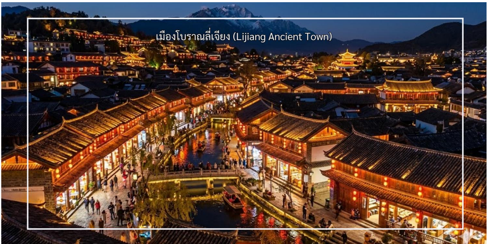
เมืองโบราณลี่เจียง (Lijiang Ancient Town)

เที่ยวชม เมืองโบราณลี่เจียง (Lijiang Ancient Town) เป็นหนึ่งในเมืองโบราณที่มีชื่อเสียงและได้รับการขึ้นทะเบียนเป็นมรดกโลกจากองค์การยูเนสโกในปี 1997 ตั้งอยู่ในมณฑลยูนนาน ประเทศจีน เมืองนี้มีความสำคัญทั้งในด้านประวัติศาสตร์และวัฒนธรรม เมืองโบราณลี่เจียงมีสถาปัตยกรรมที่สวยงามและเป็นเอกลักษณ์ โดยมีบ้านเรือนที่สร้างขึ้นในสไตล์ดั้งเดิมของชาวหน่าซี (Naxi) ซึ่งมีการตกแต่งที่ละเอียดอ่อนและสวยงาม มีคลองและสะพานที่สวยงาม ซึ่งสร้างบรรยากาศที่เงียบสงบและโรแมนติก นักท่องเที่ยวสามารถเดินเล่นริมคลองและถ่ายรูปได้ มีตลาดที่ขายสินค้าท้องถิ่น เช่น เครื่องประดับแบบดั้งเดิม อาหารพื้นเมือง และของที่ระลึก นักท่องเที่ยวสามารถเลือกซื้อของที่ระลึกและสัมผัสกับบรรยากาศของตลาด