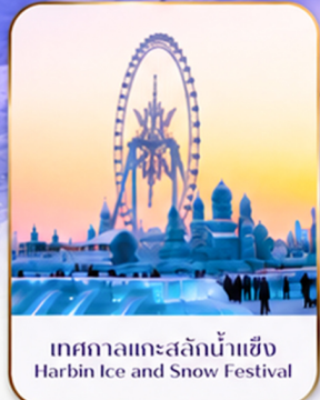
เทศกาลแกะสลักน้ำแข็ง Harbin Ice and Snow Festival