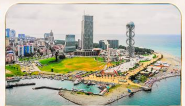
เมืองชายทะเล บาดูมี