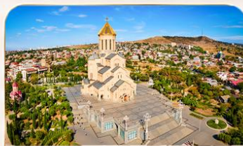
โบสถ์กรินิตี