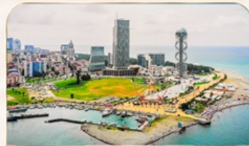
เมืองชายทะเล บาดูมิ