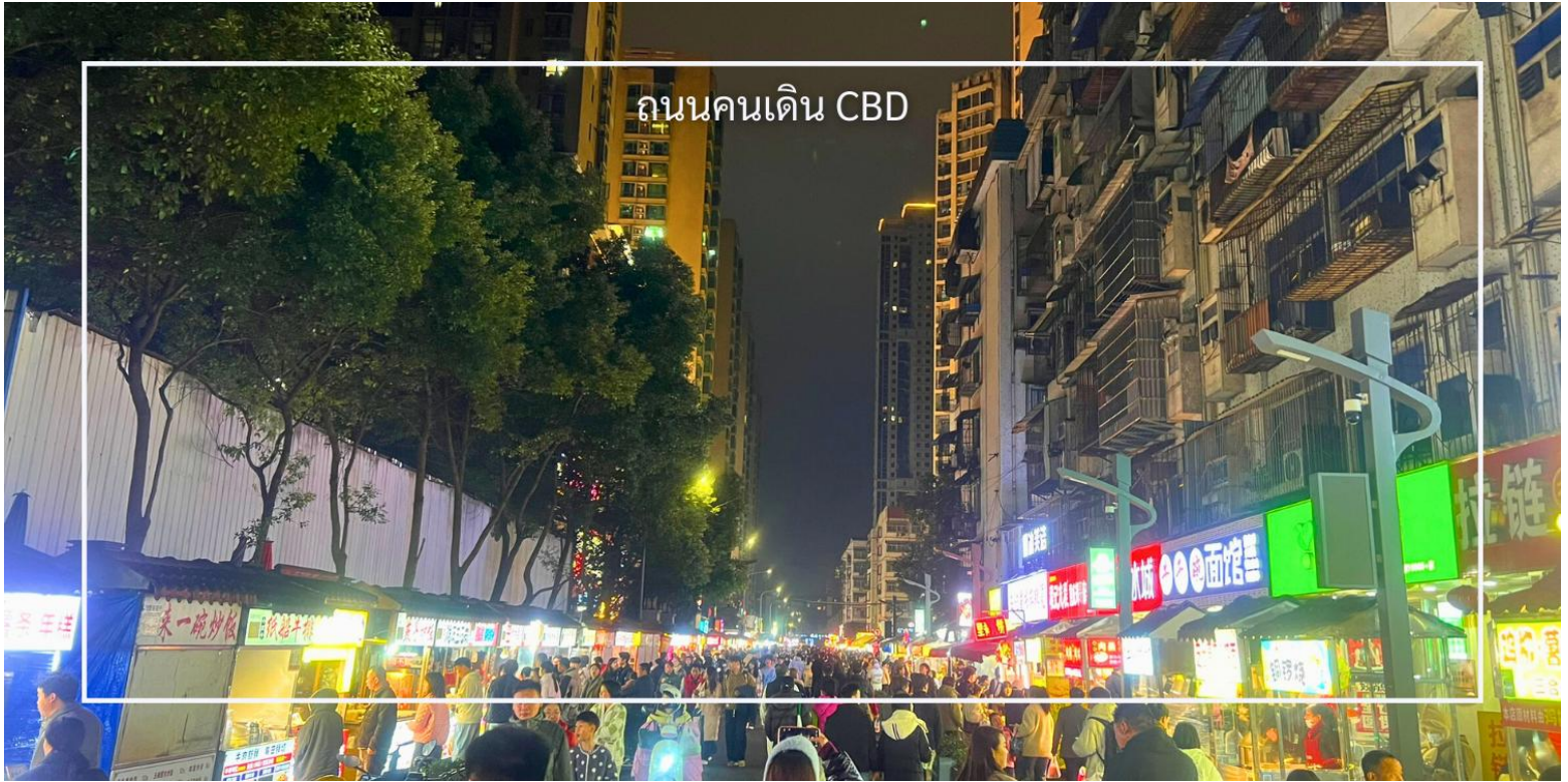
ถนนคนเดิน CBD

จากนั้นนำท่านเดินทางกลับเมือง อี้ซาง (Yichang) (ใช้เวลาประมาณ 3.30 ชั่วโมง) เดินทางสู่ ถนนคนเดิน CBD ย่านการค้า และสตรีทฟู้ดใจกลางเมืองอี้ซาง แหล่งรวมอาหารท้องถิ่น เสื้อผ้าแฟชั่น และห้างสรรพสินค้ามากมาย เหมาะสำหรับเดินช้อปปิ้งและสัมผัสวิถีชีวิตคนเมือง นวมถึงร้านของสะสมอดนิยมที่ได้รับความนิยมอย่างมากในกลุ่มคนรุ่นใหม่