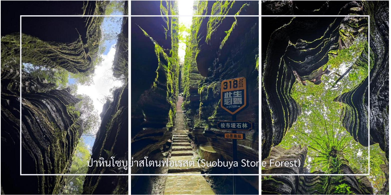
ป่าหินโซบูย่าสโตนฟอเรสต์ (Suobuya Stone Forest)