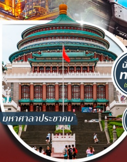
มหาศาลาประชาชน