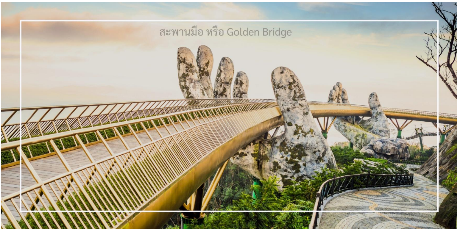
สะพานมือ หรือ Golden Bridge

นำท่านชม สะพานมือ หรือ Golden Bridge สะพานที่ตั้งอยู่บนยอดเขาบานาฮิลล์นี้มีลักษณะโดดเด่นด้วยมือยักษ์ที่ยกสะพานขึ้น ทำให้ดูเหมือนเป็นการเชื่อมต่อระหว่างสวรรค์และโลกมนุษย์ เพลิดเพลินกับวิวทิวทัศน์ที่สวยงามของธรรมชาติรอบๆ และสัมผัสความรู้สึกอันน่าตื่นเต้นเมื่อยืนอยู่บนสะพานที่สูงเหนือเมฆ ที่นี่ไม่เพียงแต่เป็นสถานที่ถ่ายรูปที่ยอดเยี่ยม แต่ยังเป็นสัญลักษณ์ของบานาฮิลล์อีกด้วย