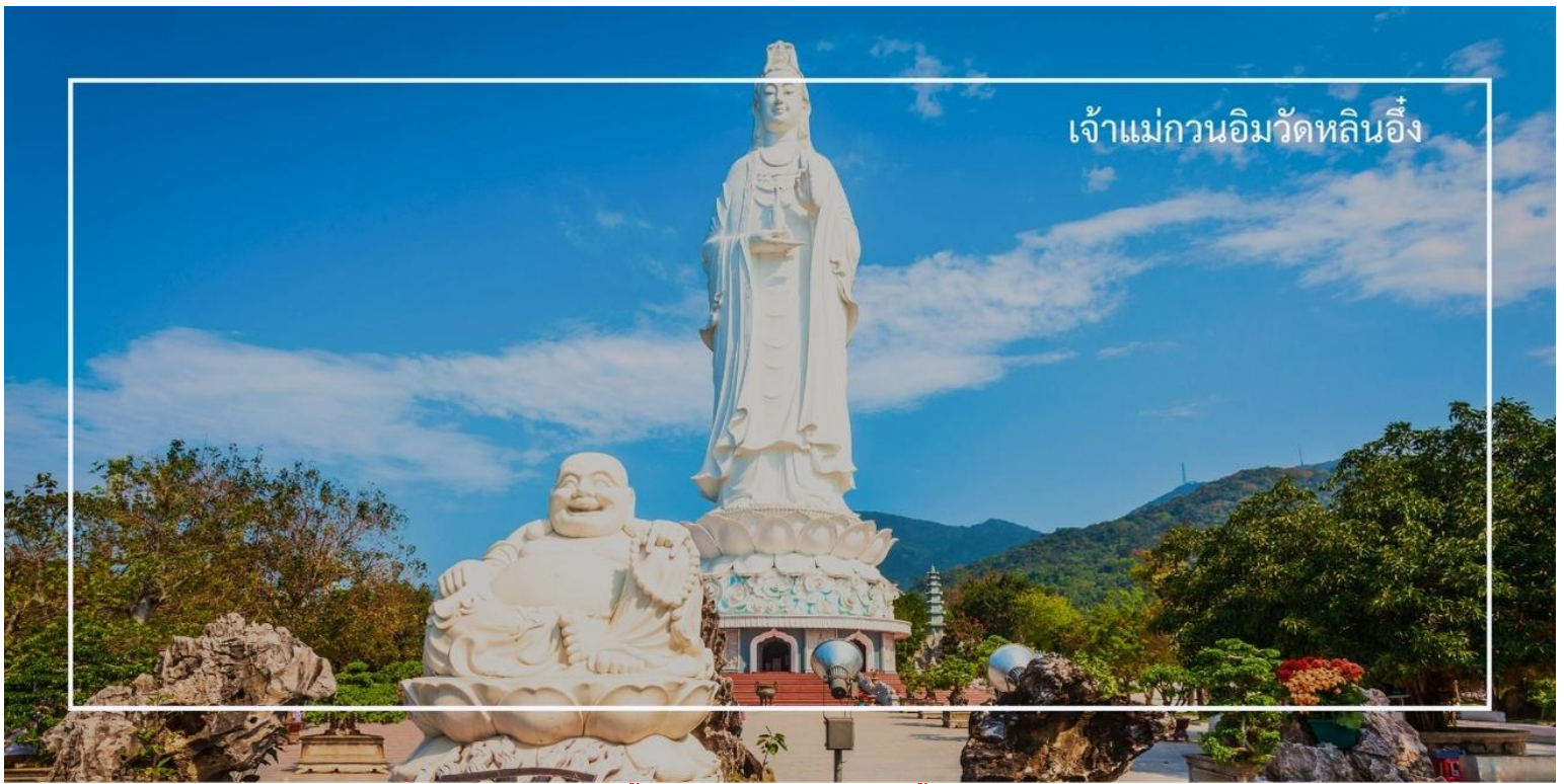
เจ้าแม่กวนอิมวัดหลินอึ้ง

เที่ยง รับประทานอาหารเที่ยง ณ ภัตตาคาร (มื้อที่ 7) เมนูพิเศษ บุฟเฟ่ต์ปิ้งย่าง