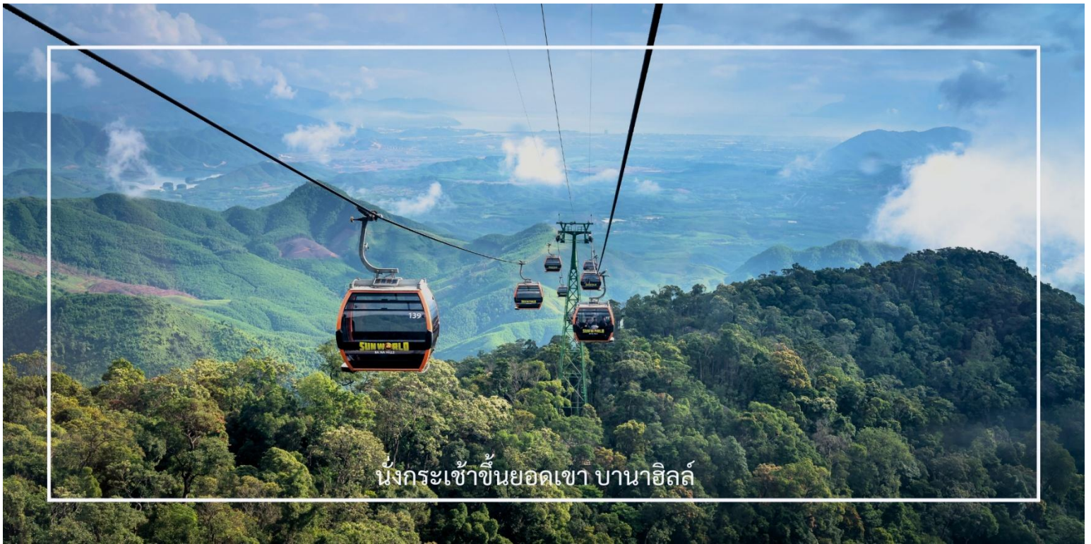
นั่งกระเช้าขึ้นยอดเขา บานาฮิลล์

นำท่านชม สะพานมือ หรือ Golden Bridge สะพานที่ตั้งอยู่บนยอดเขาบานาฮิลล์นี้มีลักษณะโดดเด่นด้วยมือยักษ์ที่ยกสะพานขึ้น ทำให้ดูเหมือนเป็นการเชื่อมต่อระหว่างสวรรค์และโลกมนุษย์ เพลิดเพลินกับวิวทิวทัศน์ที่สวยงามของธรรมชาติรอบๆ และสัมผัสความรู้สึกอันน่าตื่นเต้นเมื่อยืนอยู่บนสะพานที่สูงเหนือเมฆ ที่นี่ไม่เพียงแต่เป็นสถานที่ถ่ายรูปที่ยอดเยี่ยม แต่ยังเป็นสัญลักษณ์ของบานาฮิลล์อีกด้วย