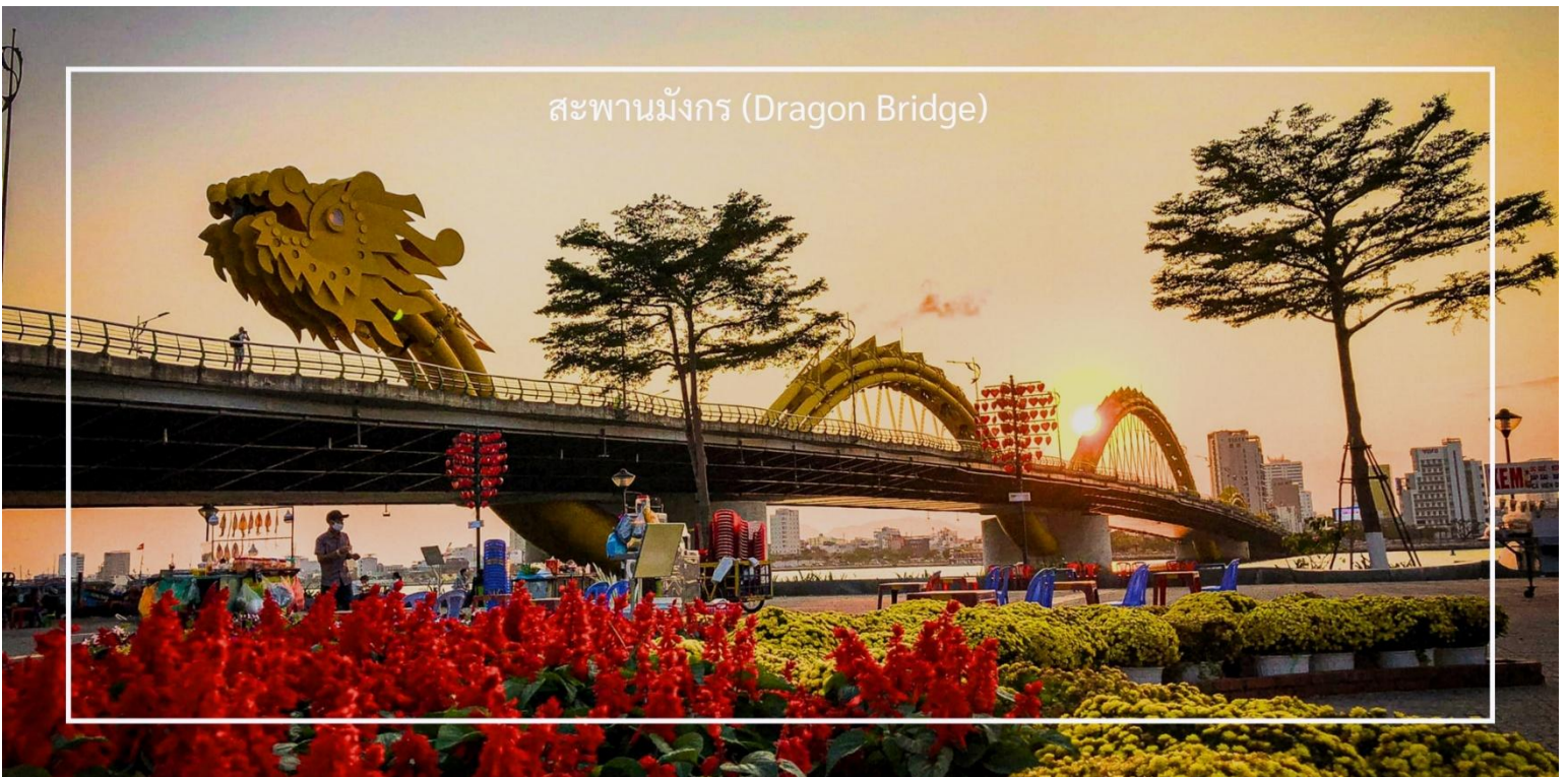
สะพานมังกร (Dragon Bridge)

นำท่านสู่ สะพานมังกร (Dragon Bridge) เป็นหนึ่งในสัญลักษณ์ที่สำคัญของเมืองดานัง และเป็นสะพานที่มีความสวยงามและโดดเด่นมาก สะพานนี้มีรูปทรงเป็นมังกร ซึ่งเป็นสัญลักษณ์ของพลังและความโชคดีในวัฒนธรรมเวียดนาม สะพานมังกรเชื่อมต่อระหว่างสองฝั่งของแม่น้ำฮัน และไม่เพียงแต่เป็นทางผ่านที่สำคัญ แต่ยังเป็นจุดชมวิวที่ยอดเยี่ยมที่คุณสามารถมองเห็นวิวทิวทัศน์ของเมืองได้อย่างชัดเจน ในช่วงกลางคืน สะพานจะถูกประดับด้วยไฟ LED ที่สวยงาม ทำให้บรรยากาศโดยรวมเต็มไปด้วยสีสันและความมีชีวิตชีวา