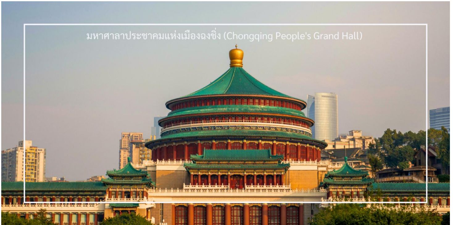
มหาศาลาประชาชนแห่งเมืองฉงชิ่ง (Chongqing People's Grand Hall)

สวยงาม ซึ่งทำให้เป็นที่น่าสนใจในการถ่ายภาพ มหาศาลาประชาชนแห่งนี้ใช้เป็นสถานที่จัดการประชุม ตลอดจนกิจกรรมทางวัฒนธรรม เช่น คอนเสิร์ต การแสดงศิลปะ และพิธีการต่างๆ