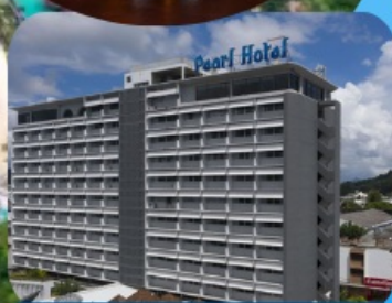
โรงแรมเพิร์ล