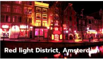
Red light District, Amsterdam