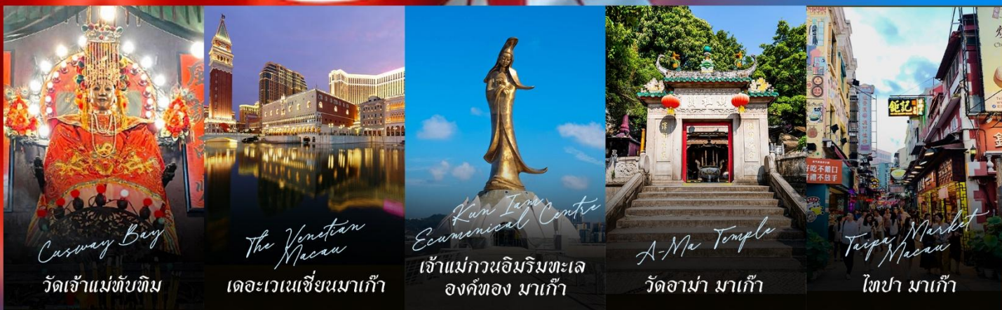
Casway Bay วัดเจ้าแม่ทับทิม

รายการทัวร์ข้างต้นอาจมีการปรับเปลี่ยนเพื่อความเหมาะสม