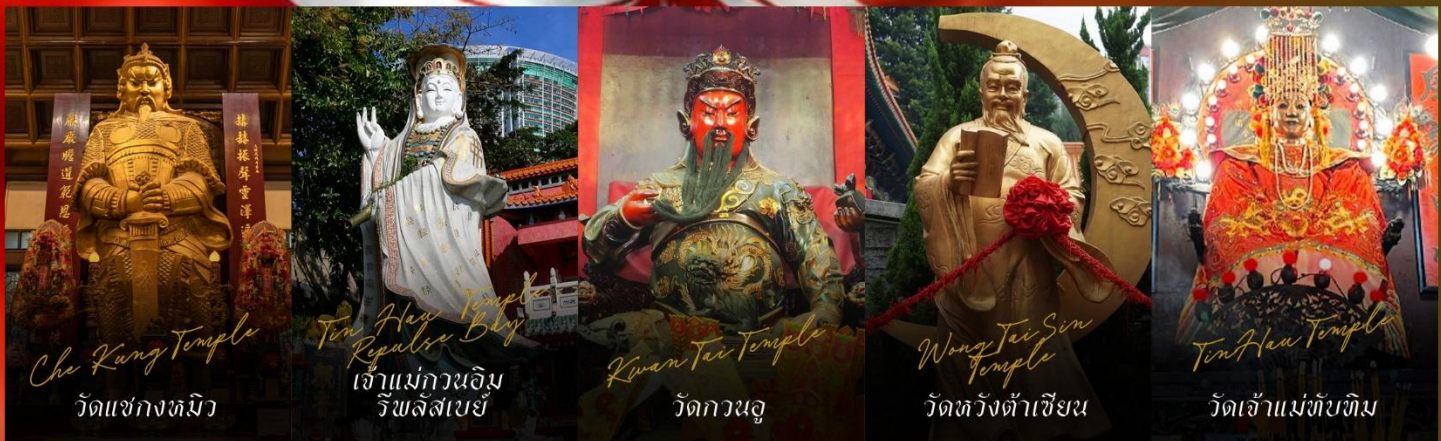
Che Kung Temple วัดแซกงหมิว

รายการทัวร์ข้างต้นอาจมีการปรับเปลี่ยนเพื่อความเหมาะสม