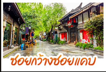
ชอยกวางชอยแปบ