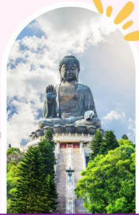
นั่งกระเช้านองปิง นมัสการพระใหญ่โป่วหลิน