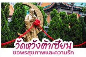
วัดหวังต้าเซียน ขอพรสุขภาพและความรัก

ขอพรเจ้าแม่กวนอิมวัดซีซ่าน ที่สูงเป็นอันดับ 2 ของโลก นั่งกระเช้าเองปีงสักการะพระใหญ่เทียนถาน • ขอพรองค์แซง โชคลาภ การเงินและธุรกิจ • ซ็องปีงจู่ใจย่านจิมซาจุ่ย และ CITYGATE OUTLETS