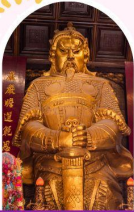
วัดเซกวง ขอพรโชคลาภ การเงิน และธุรกิจ

"ไหว้พระ เสริมดวง เพิ่มสิริมงคลแก่ชีวิต"