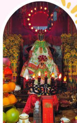
วัดเจ้าแม่กวนอิมฮ่องฮำ ขอพรเรื่องเงิน ทรัพย์สิน และความมั่งคั่ง