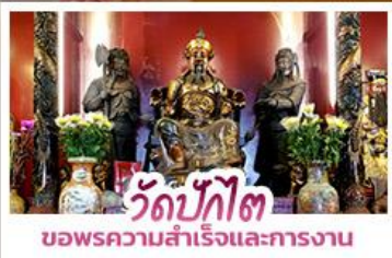
วัดบักโต ขอพรความสำเร็จและการทำงาน