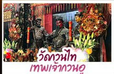
วัดกวนไท เทพเจ้ากวนอู