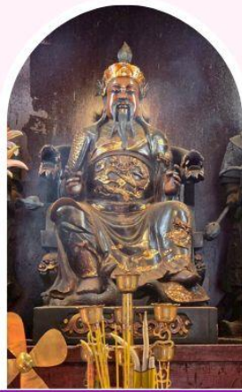
วัดปักโต เสริมโชคลาภ นำพาความรุ่งเรือง