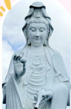
วัดเจ้าแม่กวนอิมซี้ซัน ความเมตตา ความสงบ สิริมงคล