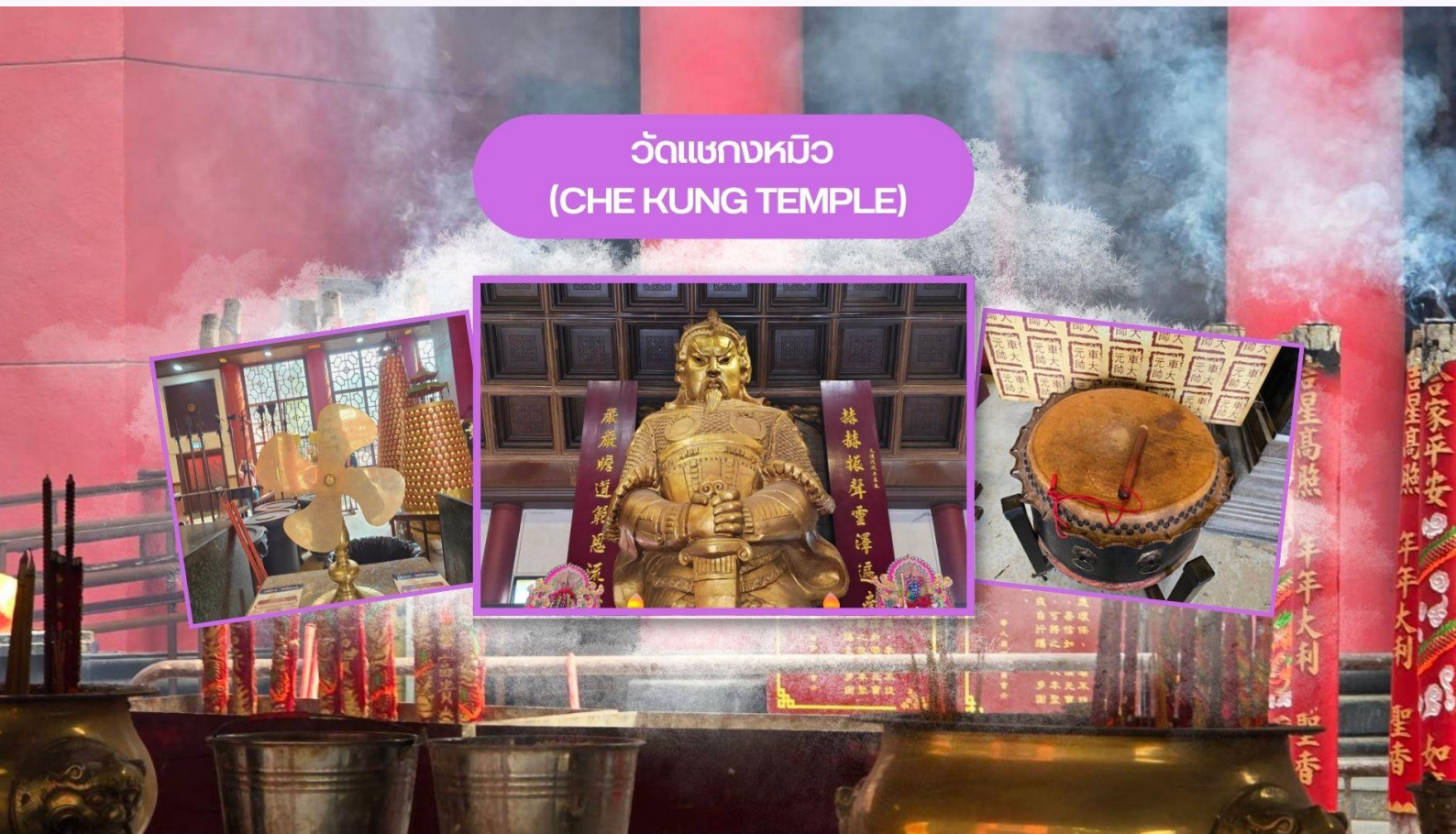
วัดแซงหมิว (CHE KUNG TEMPLE)