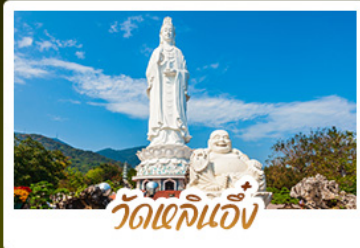
วัดเจดีย์แก้ว