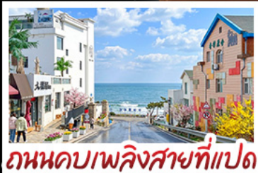
ถนนคอบเบิลซายที่แปด