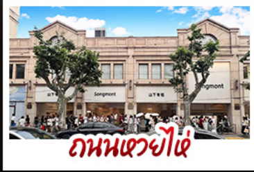
ถนนเซวี่ไผ่