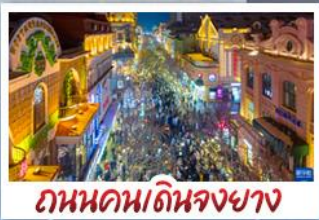
ถนนคนเดินจงยาง