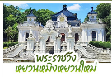
พระราชวัง แสงตะวัน เขาวงกตเขาวงกต