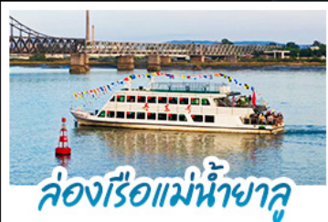
ล่องเรือแม่หน้าจาลู