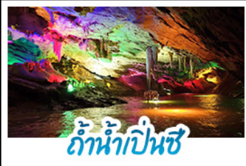
ถ้ำน้ำเป้นช้

แกรนต์เห็ยวหึง 5 นคร...ชมเวนิสตำหลยสนุดมึง เห็ยชยแตนตมตงสุดล้ง ล่งถ้ำน้ำเป็นช้สุดล้ง ย็อนรอยวงเส้นหยงกึ่ง