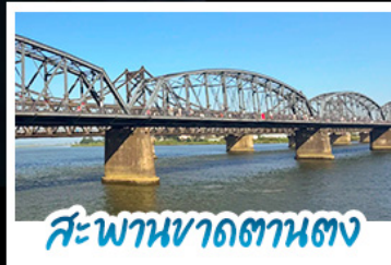
สะพานขาดสถานตง