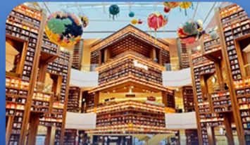
ต้องสัมผัสตึกราม