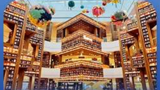
ต๋องกมุดคตาร์ทพีค