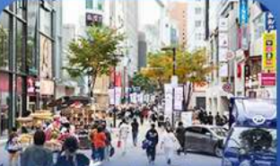
ช้อปบิงข่านเมียงดง