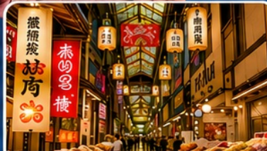
ตลาดปลาชิซึกิ