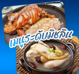
เมนูระดับมิชลิน

เที่ยวครบ 3 เมืองฮิต โซล - แทกู - ปูซาน สัมผัสเสน่ห์เกาหลีหลากหลายสไตล์ • ชมพระราชมังคลาภิเษกตึก Lotte World Tower พร้อมจุดชมวิว Seoul Sky ในกรุงโซล • ชีคอินถนน Art Street ตามรอย BTS ตลาดชอนจู • แลนด์มาร์ก 83 Tower ที่แทกู • ปักกายกีปูซานกับวิวไฮแลนด์ยงกุงซา หมู่บ้านวัฒนธรรมคิมซอน ไฮไลท์นั่งรถไฟสายแคปซูลชมวิวทะเลสุดประทับใจ • เดินทางสะดวกด้วยรถไฟความเร็วสูง KTX อิ่มอร่อยกับเมนูพิเศษ 11 เมนูเกาหลีและไก่ตุ๋นโสมระดับมิชลิน ที่ครบทุกความประทับใจในทริปเดียว