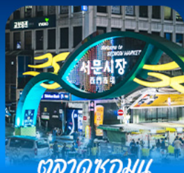
ตลาดชอนจู