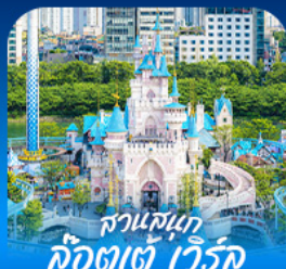
สวนสนุก ก็อตตา เวิร์ด