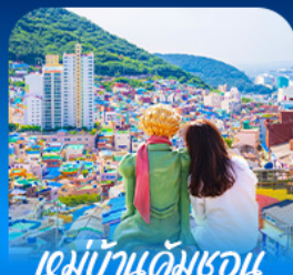
หมู่บ้านดัมซอน