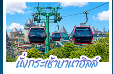
นั่งกระเช้าฮานเออิล