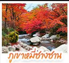
ภูเขาหมี่ชางชาน