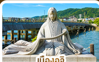
เมืองอูจิ สวรรค์คนรักชาเขียว