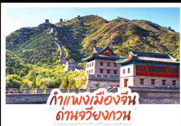
กำแพงเมืองจีน ด่านจวิ๋นกวาน