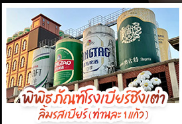
พิพิธภัณฑ์โรงเบียร์ชิงเต่า ลิมรสเบียร์ (ทำนคะ 1 แก้ว)