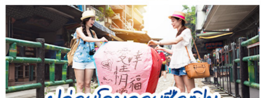
ปลั๊กอินคอมลอสซี่ซ้อทไฟน