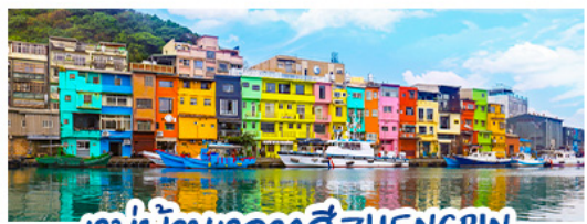
หมู่บ้านหลากสี ZHENG BIN